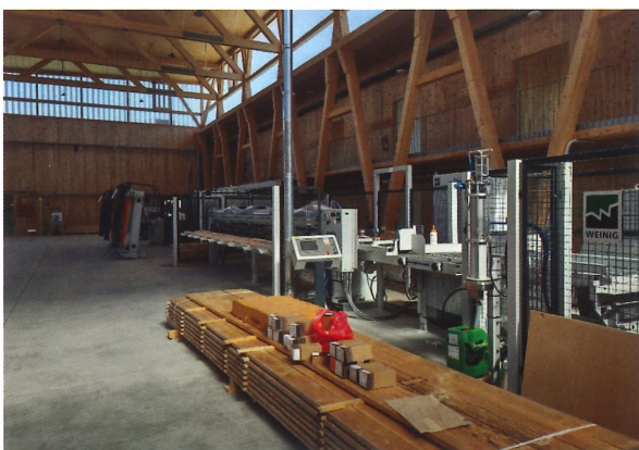
Fotografia 2. El propi edifici és un exemple d'edificació amb productes de fusta local estructural. A l'interior destaca la línia de fabricació de peces laminades com ara bigues i CLT d'escala industrial.