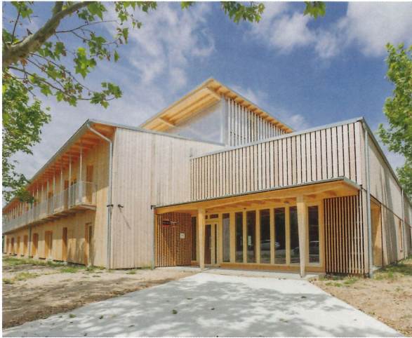
Fotografia 1. Les instal·lacions principals del Hub Forestal es troben a Oliu, al Solsonès.

A les instal·lacions d'Oliu, en un edifici de fusta local de més de 1.200 m 2 , el Hub disposa d'infraestructures úniques per escalar la innovació, que són: