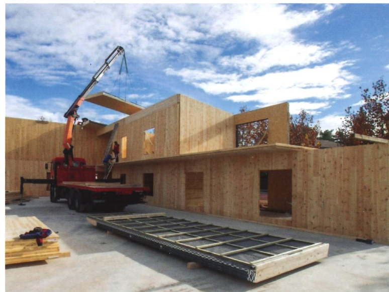
Fotografia 3. Construcció industrialitzada amb fusta estructural local: una cadena de valor forestal de gran potencial transformador del paisatge català.

S'hi realitzaran accions de formació per tota la cadena, des de la prescripció (l'arquitectura per a l'ús de la fusta) fins a la fabricació i muntatge, amb assessorament cap als promotors públics i privats. Paral·lelament s'impulsaran accions d'innovació que poden canalitzar-se amb start-ups , tot acollint i donant suport a empreses d'innovació de les línies de fusta, bioquímica i plantes aromàtiques i medicinals i usuaris finals dels productes en aquestes instal·lacions.